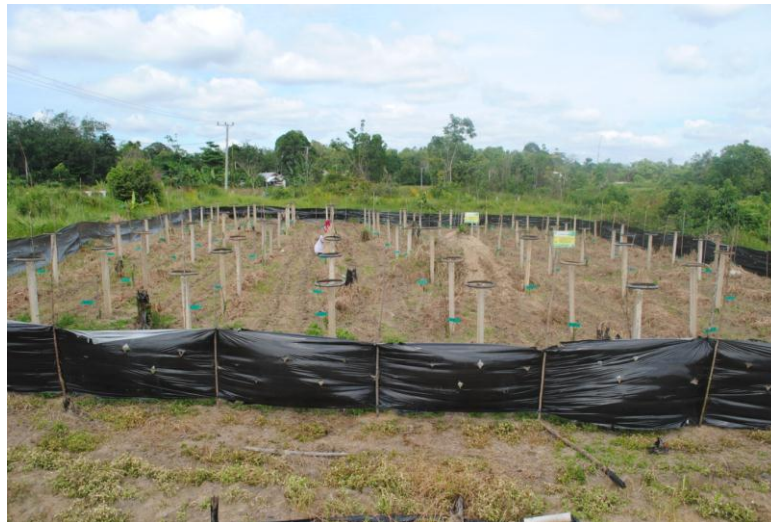
Gambar 5. Keadaan Lahan Setelah Tanam Buah naga

Lahan buah naga yang telah ditanam, dirawat dan diamati dengan baik. Perawatan meliputi penyiangan, pemupukan, dan pemasangan plastik mulsa untuk mengatasi serangan hama terutama babi hutan. Lahan buah naga sangat terlihat karena adanya tiang panjat yang telah terpancang sehingga penampilan lahan lebih baik setelah di lakukan kajiwidya. Pengamatan dilakukan seminggu sekali untuk mengetahui pertumbuhan tanaman tersebut.