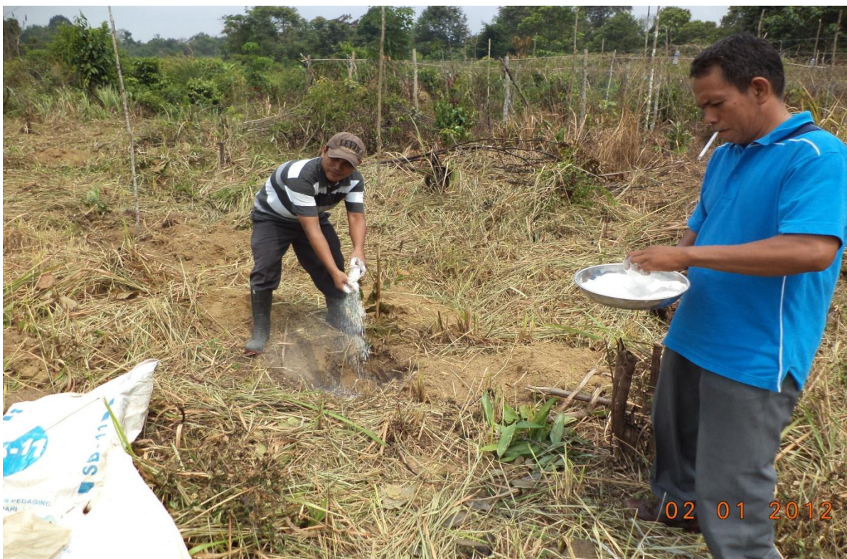
Foto 6. Pengapuran lahan Buah Naga