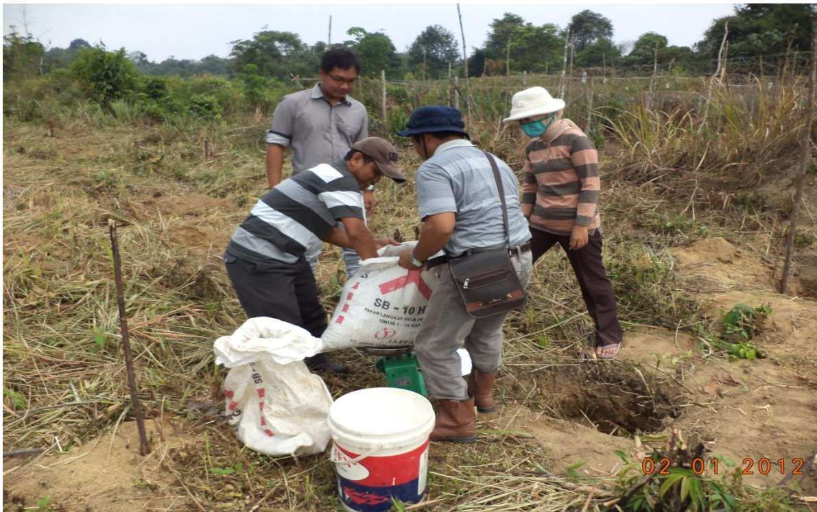
Foto 5. Pemberian Pupuk Kandang dan pasir