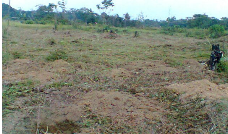
Gambar 4. Kondisi Lahan Setelah ditebas

Dalam melakukan pembukaan lahan kajiwidya, langkah yang dilakukan yaitu melakukan penebasan lahan terlebih dahulu, sehingga lahan menjadi bersih/kondisi baik dan siap untuk ditanami buah naga, seperti pada gambar berikut.