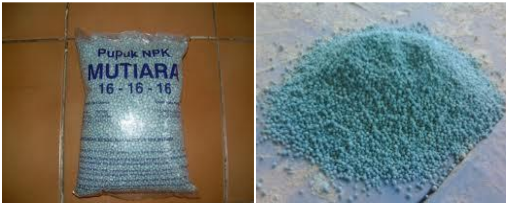
Gambar 1. Pupuk NPK Mutiara 16-16-16

Pupuk NPK Mutiara merupakan pupuk NPK yang mempunyai kandungan N 16%, P 2 O 5 16% dan K 2 O 16% Kandungan dalam NPK Mutiara hampir seluruhnya larut dalam air sehingga seluruhnya dapat terserap oleh tanaman serta kandungan unsur hara yang lengkap dan berimbang menjadikan tanaman sehat dan kuat.