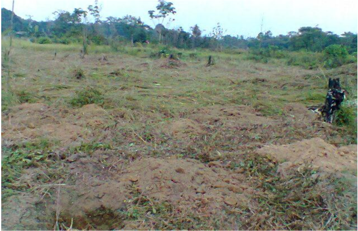
Foto 3. Kondisi lahan Kajiwidya Setelah di Tebas