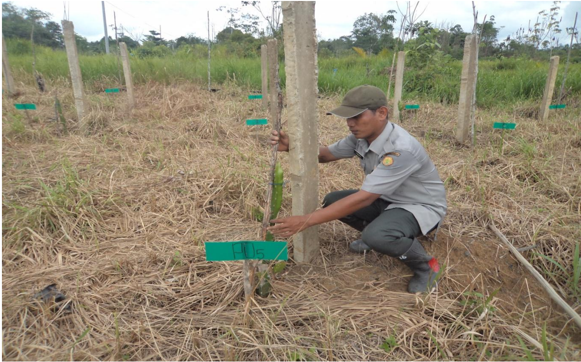
Foto 7. Pengamatan Pertumbuhan Buah Naga