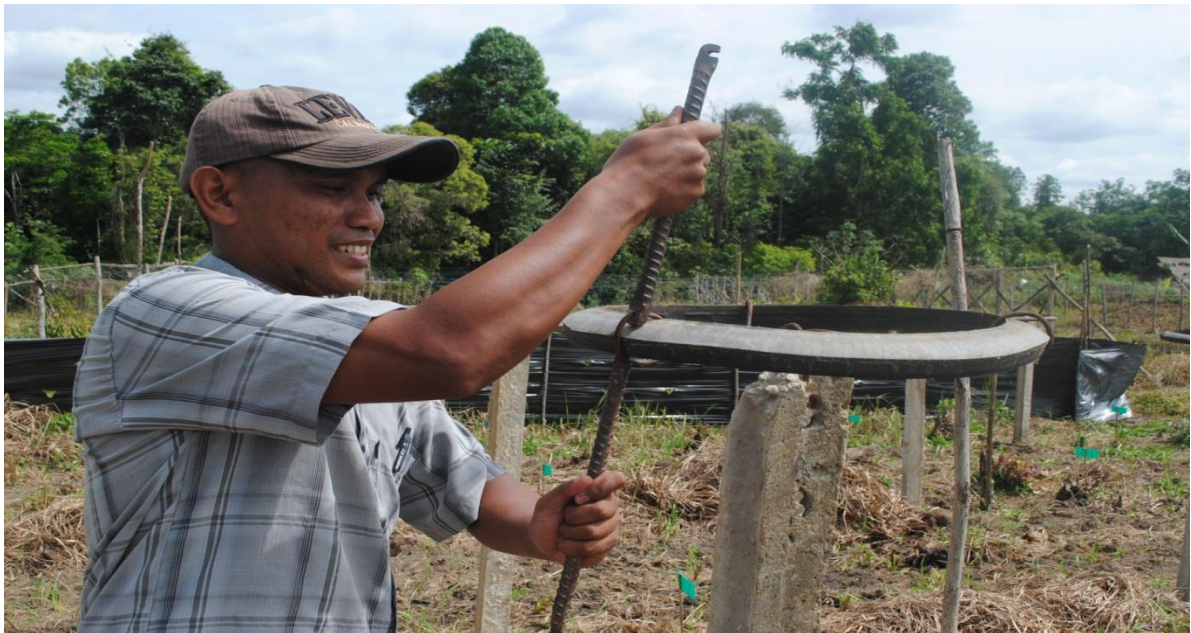
Foto 8. Pemasangan Lingkaran Ban