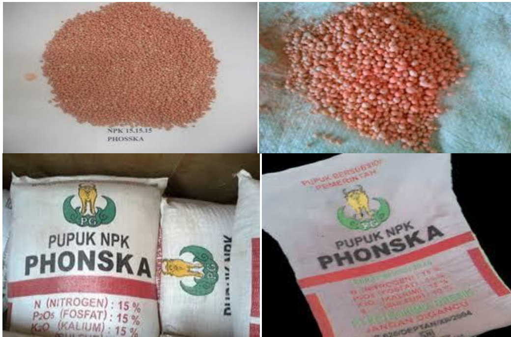
Gambar 2. Pupuk NPK Phonska

Dalam NPK Phonska terkandung Nitrogen (N) : 15%, Fosfat ( P_2O_5 ) : 15%, Kalium ( K_2O ) : 15%, Sulfur (S) : 10%. NPK Ponska berbentuk butiran dan berwarna merah muda, dikemas dalam kantong/karung bercap kerbau emas dengan isi 50 kg dan 20 kg