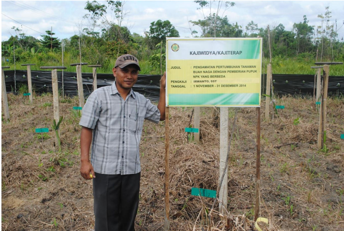
Foto 9. Pemasangan Plang Nama Kajiwidya