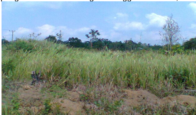
Gambar 4. Keadaan lahan sebelum tanam Buah Naga

Lahan yang digunakan untuk penanaman buah naga di BP3K Pelayung berupa tumbuhan alang-alang dengan ketinggian sekitar 120 – 150 cm. Selain alang-alang, adanya tunggul-tunggul bekas kayu tebangan juga mendominasi keadaan lahan tersebut. Secara umum keadaan lahan datar, hanya pada satu tempat terdapat gundukan tanah dengan ketinggian sekitar 1,3 meter.